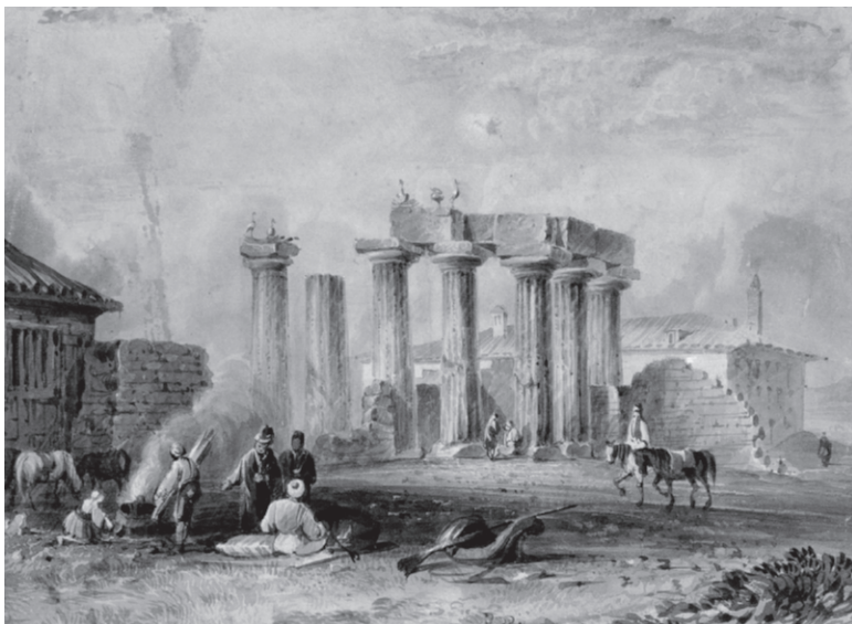
Ο ναός του Απόλλωνα στην Κόρινθο. ΜΟΥΣΕΙΟ ΜΠΙΕΝΑΚΗ